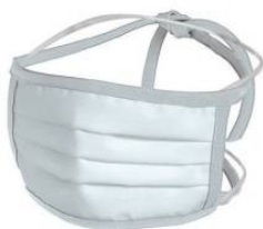
Large: 20x10 cm Bianca

Dermatologicamente testata • Massima tutela igienica: in uso su naso e bocca e in pausa su collo senza doverla appoggiare in ambiente non protetto • Forma a soffiato per una corretta e confortevole vestibilità • Sacchetto porta-mascherina in politene con zip a pressione RIUTILIZZABILE • Sanificate con trattamento a raggi gamma • Molto confortevoli anche se usate tutto il giorno • Ideale sulla pelle anche con alte temperature