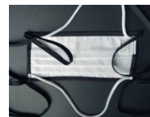
Interno bianco - esterno tinta unita