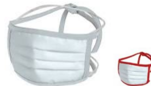
Small: 16x8 cm Bianca con cordini colorati