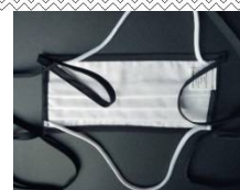
Interno bianco - esterno tinta unita

Efficienza di filtrazione batterica (BFE): \geq 95\%