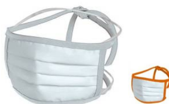
Medium: 18x9 cm – Bianca con cordini colorati