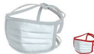
Small: 16x8 cm Bianca con cordini colorati