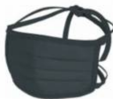
Large: 20x10 cm Verde petrolio