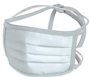
Large: 20x10 cm Bianca

RIUTILIZZABILE • Sanificate con trattamento a raggi gamma • Molto confortevoli anche se usate tutto il giorno • Ideale sulla pelle anche con alte temperature